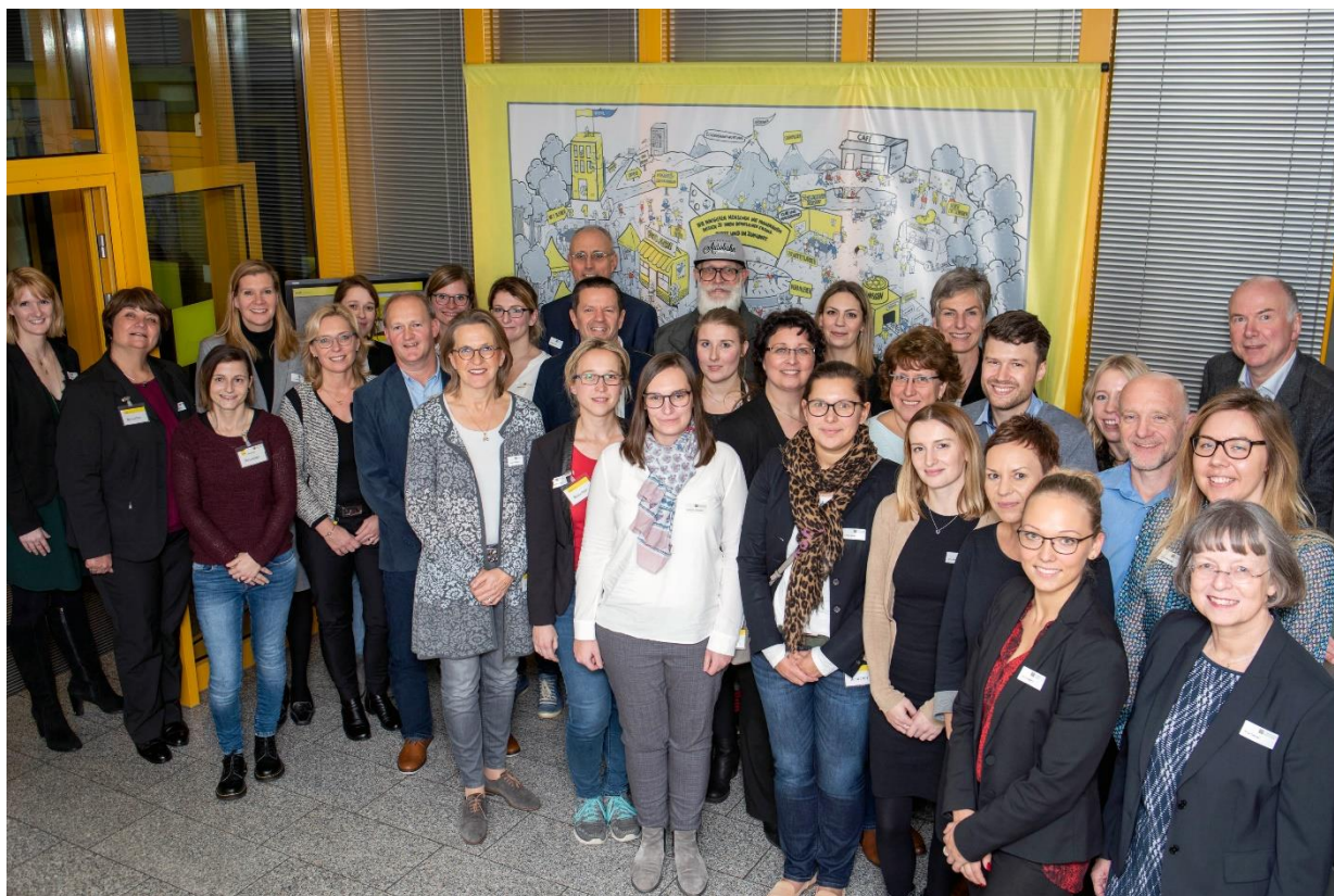
Der 7. Jahrgang im X-Mentoring Rhein-Ruhr 2019/2020

Allen Beteiligten ist es ein Anliegen, Nachwuchskräfte durch persönliche Begleitung von erfahrenen Führungskräften zu unterstützen und damit ihre Potentiale wirkungsvoll aufzugreifen. Mentoring hilft, Karrierehindernisse zu überwinden. Wenn die fachliche Qualifikation stimmt, heißt es in Bezug auf berufliche Karrieren Ziele und Stärken, Netzwerke und Förderer, Selbstvertrauen und Strategie zu entwickeln. Mentoring zeigt Wege auf, die eigenen Fähigkeiten für das Unternehmen richtig zur Geltung zu bringen und die Spielregeln der Arbeitswelt für sich zu nutzen. Und das gilt für den Berufseinstieg ebenso wie für den Aufstieg. Besonders firmenübergreifende Mentorings fördern die Unterstützung ohne Loyalitätskonflikte.